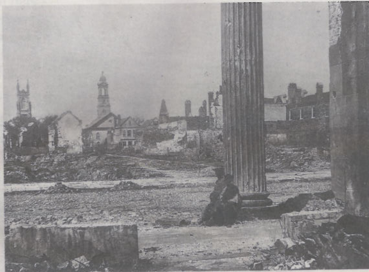
Store ødeleggelser: South Carolina var den første staten som brøt ut av unionen, og den siste som ble gjenopptatt. Delstaten opplevde store ødeleggelser, som her i hovedstaden Charleston.